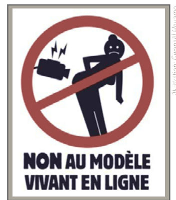
Illustration: Gwenaél Houarno

Au vu des obligations légales du RGPD et de l'article 9 du code civil, ce mode de transmission n'est pas acceptable. Le corps nu reste l'outil de travail du ou de la modèle, continuons d'interdire l'utilisation de la photo et de la vidéo en salle de cours, ainsi que l'enregistrement et la captation d'images avec retransmission.