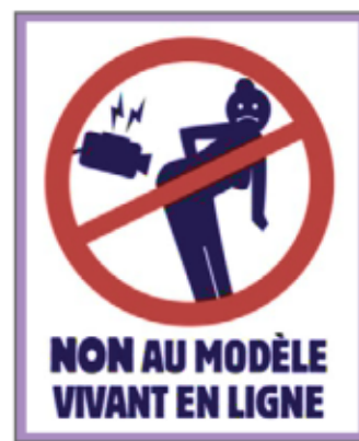
Illustration: Gwenael Houarno

Au vu des obligations légales du RGPD et de l'article 9 du code civil, ce mode de transmission n'est pas acceptable. Le corps nu reste l'outil de travail du ou de la modèle, continuons d'interdire l'utilisation de la photo et de la vidéo en salle de cours, ainsi que l'enregistrement et la captation d'images avec retransmission.