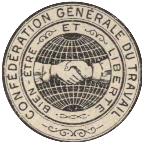
Le Label confédéral et sa devise, 1904.

Un calendrier des formations, un descriptif des programmes, ainsi que la démarche à suivre sont présentés pages suivantes.